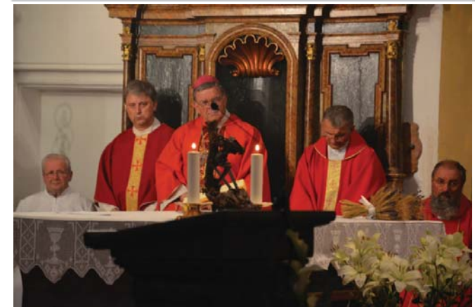
Utrinek iz slavlja srebrnomašnikov celjske škofije v Laškem, 29.06. 2015